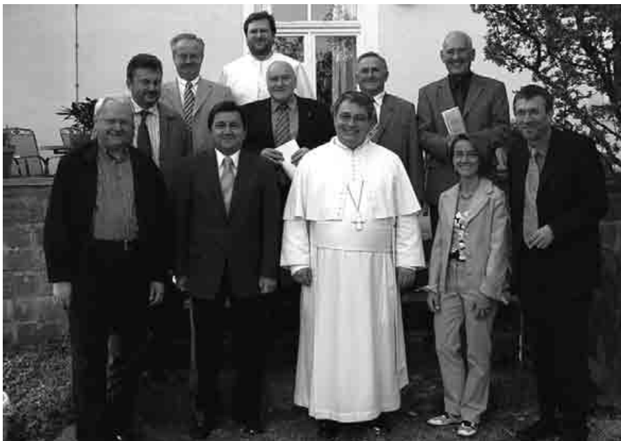
Gründung des Freundeskreises der Abtei Windberg

Die Idee, in Windberg Menschen um sich zu sammeln in einem Freundeskreis, die die Ideen und Pläne, die Projekte und Aktionen der Klostersgemeinschaft mittragen und mitfordern, gab es schon lange. In dem vergangenen Jahr nahm diese Idee nun konkrete Gestalt an. Nach einigen Gesprächen, die uns zu diesem Schritt ermutigten, gingen wir daran, eine eigene Satzung für einen möglichen Freundeskreis zu erarbeiten. Nachdem Menschen gefunden waren, die in diesem neuen Verein auch Verantwortung übernehmen würden, wurde in einem kleinen Kreis am Samstag, den 30. April 2005, der „Freundeskreis der Abtei Windberg e.V.“ gegründet, der sowohl vom Amtsgericht wie auch vom Finanzamt juristisch und steuerrechtlich als gemeinnütziger Verein anerkannt wurde. Die Gründungsversammlung beriet und beschloss nicht nur die ausgearbeitete Satzung, sondern wählte auch die erste Vorstandschaft.