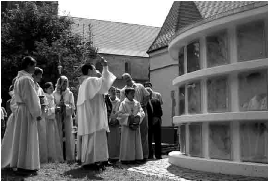
Segnung der neuen Urnenwand in Windberg