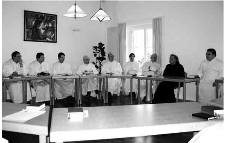
Konventsexerzitien in Bad Faulenbach