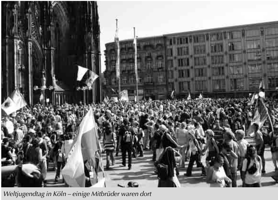
Weltjugendtag in Köln – einige Mitbrüder waren dort