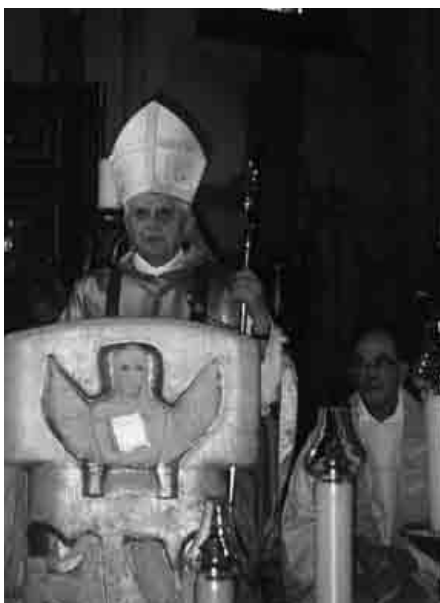
Pontifikalgottesdienst auf dem Bogenberg mit Kardinal Ratzinger

Ein Teil seines Lebens ist auch die Eisenbahn. So hält er weiterhin seine Kontakte und Freundschaften zu vielen Eisenbahnern und Eisenbahnfreunden aufrecht. In diesem Zusammenhang