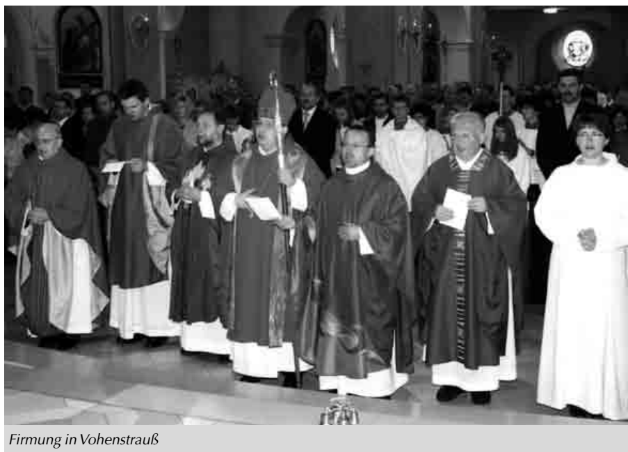
Firmung in Vohenstrauß