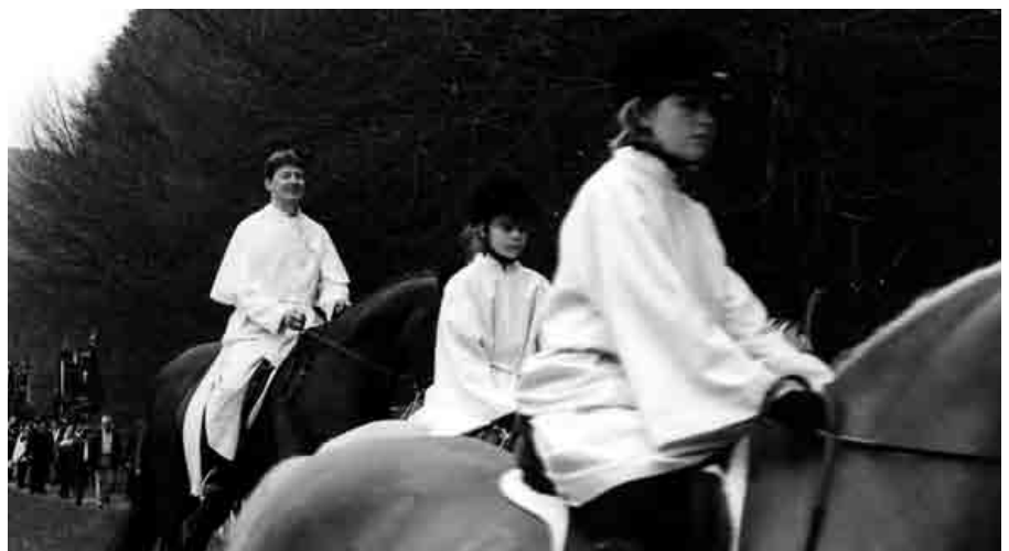
Kirchenzug hoch zu Ross