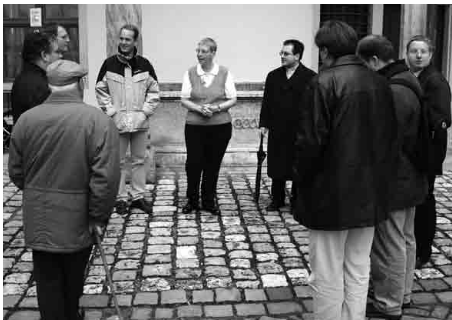
Konvenausflug nach Neuburg a. d. Donau